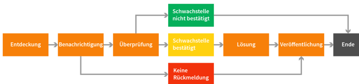
Abbildung 1 Ablauf eines Coordinated / Responsible Disclosure Prozesses 88

Bei diesem iterativen Prozess werden gefundene Schwachstellen zunächst nur derjenigen Stelle gemeldet, die die Schwachstelle verifizieren und beheben kann. Hierbei handelt es sich in der Regel um das herstellende Unternehmen (dessen Identifikation bei Lieferketten, Vertriebseinheiten, Import, etc. bereits herausfordernd sein kann). Erst nachdem eine Lösung für die Schwachstelle bereitgestellt wurde, oder wenn nach Ablauf einer angemessenen Frist zu vermuten ist, dass keine Lösung erstellt wird, wird eine Warnung an Dritte oder die Öffentlichkeit weitergegeben. Dieser Schritt ist erforderlich, um Schaden von Produktnutzen abzuwenden und ihnen zu ermöglichen, Schutzmaßnahmen zu ergreifen. Dieser Mechanismus ist in Deutschland jedoch noch nicht flächendeckend etabliert und im geltenden Rechtsrahmen nicht verankert.